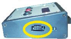
デジマチック出力